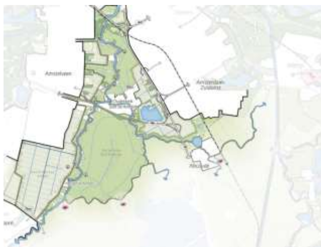
Knooppunt Holendrecht Leefomgeving

Er hebben verschillende inspreekmomenten plaatsgevonden rondom de RES 1.0 waarbij bewoners, bezoekers, maatschappelijke organisaties en andere belanghebbenden signalen konden meegeven gerelateerd aan de windzoekgebieden, zo ook Knooppunt Holendrecht. Sommige van deze signalen zijn generiek van aard, maar komen wel uit dit zoekgebied. Andere gaan specifiek over dit zoekgebied. De gemeente is zich ervan bewust dat deze generieke en specifieke zorgen op verschillende plekken door elkaar lopen. Voor uitgebreidere informatie over de generieke zorgen kunt u hier klikken, om terug te gaan naar deel 1 van dit document.