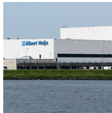
Foto: Albert Heijn distributiecentrum Zaandam

Om initiatieven voor windprojecten te helpen vormgeven en spelregels voor de participatie op te stellen heeft de gemeente Royal HaskoningDHV gevraagd een onderzoeks- en participatietraject uit te voeren. Dit traject is tweeledig ingestoken om twee niveaus van 'spelregels' op te stellen: zowel met initiatiefnemers als met de omgeving.